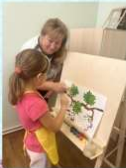
«Что умеет кисточка!»